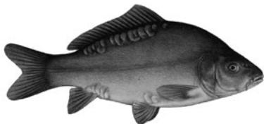
Kapor od 40 do 65cm

Za porušenie tohto uznesenia bude platiť sankcia odobratia povolenia na rybolov za príslušný rok a nevydanie povolenia na rybolov na nasledujúci rok.“