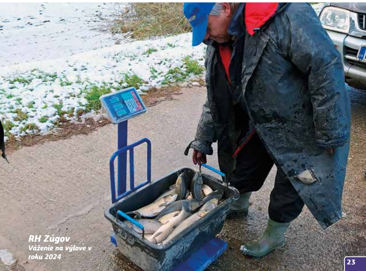
RH Zúgov Váženie na výlove v roku 2024